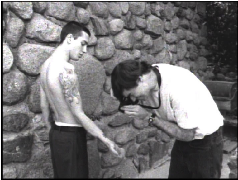
Gus Van Sant fotografa un tatuaggio di John Frusciante per il libretto dell'album BloodSugarSexMagic.

❖ Il suo ultimo lavoro, "Last Days" è stato un progetto molto desiderato da Gus Van Sant, ma ritardato nella sua realizzazione. Pare infatti che l'importanza e la delicatezza dell'argomento abbiano fatto ritardare l'esecuzione dell'opera. Inizialmente, Van Sant voleva come protagonista un attore danese, che non parlasse inglese. Il suo protagonista doveva essere infatti completamente muto.